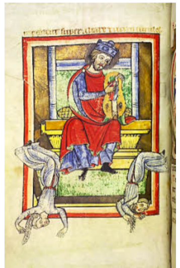
König David leiert als Popstar - die Fans schlagen Salto.

Und und und. Das Konzept geht wirklich auf. Dafür spricht die außergewöhnlich große Besucherzahl, aber auch das Echo im Gästebuch. Die Faszination dieser intimen, geradezu überweltlichen Schau bekundeten Urteile wie „eine exzellente Ausstellung der Superlative“, „eine phantastische Schatzkammer zum Ruhm und zur Ehre Bambergers“ oder: „Tief beeindruckt verlassen wir diese Ausstellung. Vor Büchern zu stehen, die hunderte von Jahren alt sind, erfüllt