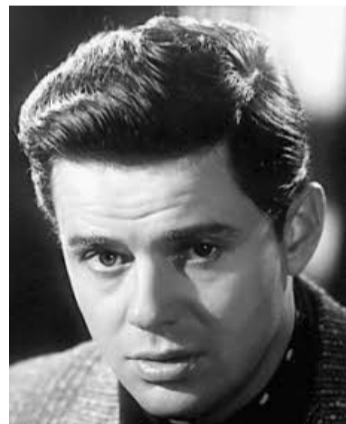
Walter Giller als Billy Cole im Film „Spion für Deutschland“ (1956)

In mehr als 80 Produktionen hat der Publikumsliebling mitgewirkt, darunter in „Peter Voss, der Millionendieb“ mit O.W. Fischer, in „Drei Mann in einem Boot“ mit Hans-Joachim Kulenkampff und Heinz Erhardt und „Schloss Gripsholm“. In letzterem Film spielte er gemeinsam mit Tiller, die er bei den Dreharbeiten zu „Schlagerparade“ (1953) kennen gelernt hatte. Trotz der Vielzahl seiner Arbeiten blieb Giller für Regisseure und Publikum fast ausnahmslos der zerknautschte Komödiant. Nur selten durfte er sich wie in Wolfgang Staudtes „Rosen für den Staatsanwalt“ oder als Ost-Berliner Lkw-Fahrer in „Zwei unter Millionen“ von ernster Seite zeigen, erntete aber gerade für diese beiden Werke jeweils einen Bundesfilmpreis (1960/62). Später