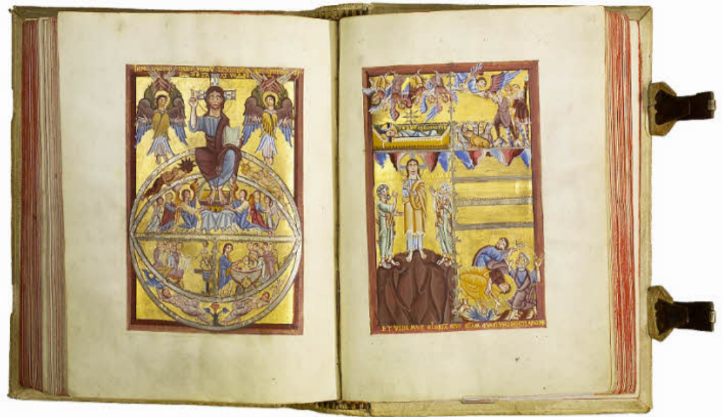
Götzenanbeter wie Täuflinge tummeln sich im Erdkreis auf der linken Miniatur des Evangeliums aus Köln. Rechts wird die Geburt Christi durch die Verklärung an den Rand gedrückt.

Oder die köstliche Miniatur des Älteren Bamberger Psalters aus der Zeit um 1210, die den König David als Popstar zeigt: Mit seiner Leier bringt er zwei Damen derart in Raserei, dass sie kopfheister Salto schlagend